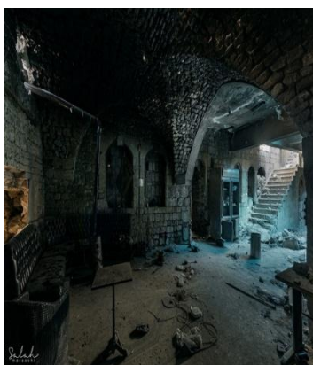
الفرافرة حلب القديمة