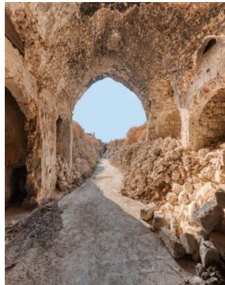
سوق العبي حلب