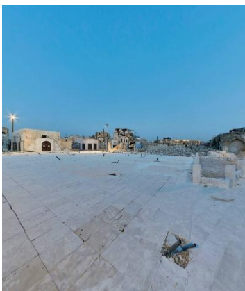
ساحة الحطب حلب القديمة