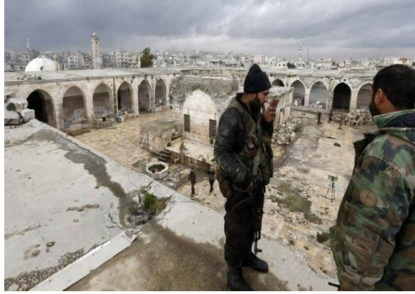
شبيحة الفيلق الخامس في متحف معرة النعمان