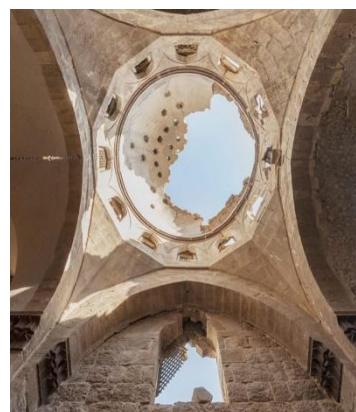
جامع بيت الوكيل حلب