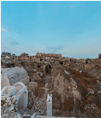
سوق الصرماياتية حلب