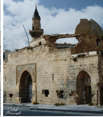
المطبخ العجمي جانب قلعة