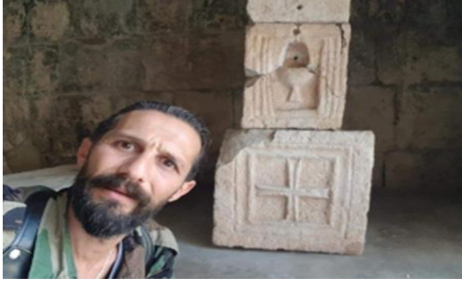
نابل العبد الله في متحف أفاميا