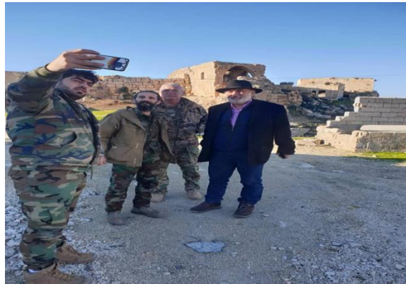
الإعلامي اللبناني المتطرف غسان الشامي – سيمون الوكيل نابل العبد الله في معرة النعمان