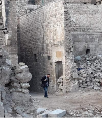
حارة الكيخيا حلب القديمة