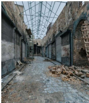
سوق الخابية حلب القديمة