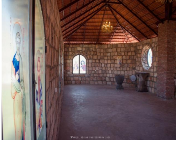
قطع اثاره مسروقة من الأماكن الأثرية ومنقولة الى كنيسة الأربعين شهيد في محردة المحدثه في ٢٠٢١