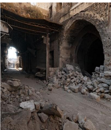
خان الصابون حلب القديمة