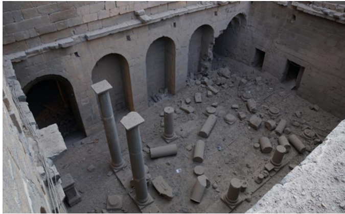
دمار في بصرى الشام