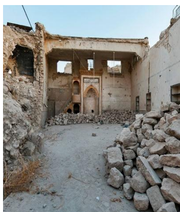
جامع سوق العطارين حلب