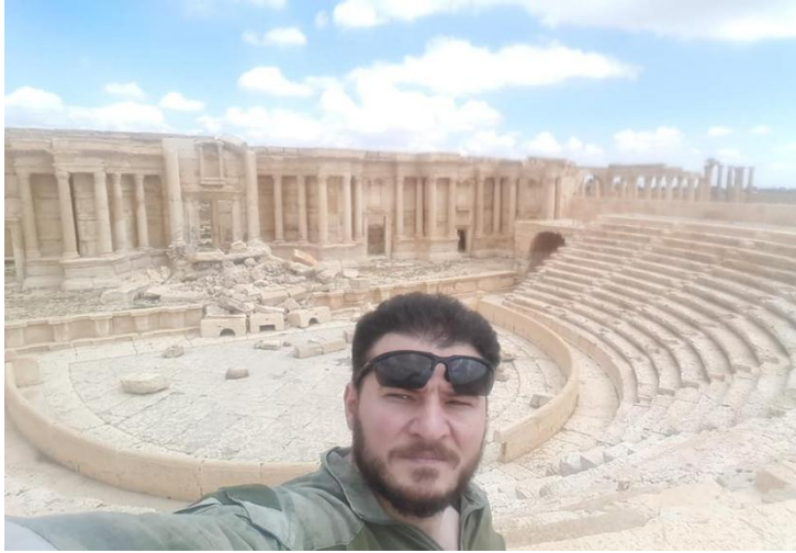
مرتزق روسي في تدمر