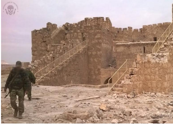
مرتزة فاغز في تدمر وتظهر أن آثار الدمار بسبب القصف والاستهداف الصاروخي