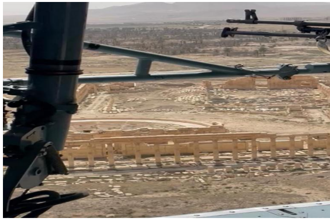
الطائرات الروسية فوق آثار تدمر