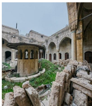
المدرسة الأحمدية حلب القديمة