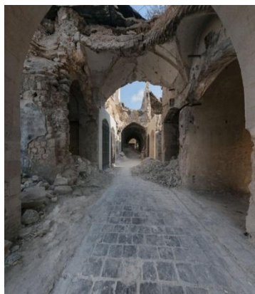
السوقة حلب القديمة