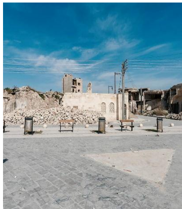
سوق الأمتنجي حلب