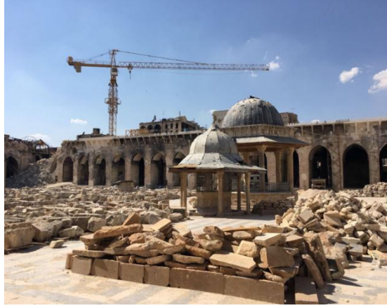
الجامع الأموي في حلب